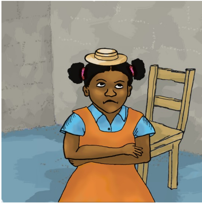
Cái nón lại quá nhỏ.