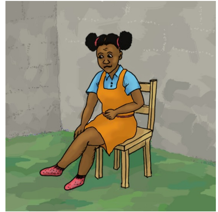
Đôi vớ thì ngắn.