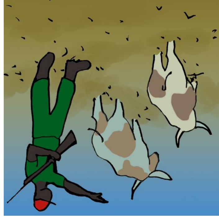
ਦੇ ਆਪਣੇ ਆਪ ਗਏ ਕੀ ਕੇ ਗਏ।