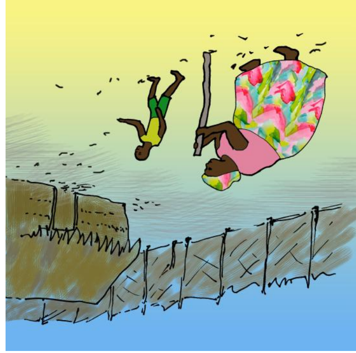
ਦੇ ਬੁਧਾਧ ਆਪਣੇ ਆਪ ਕੀ ਕੇ ਗਏ।